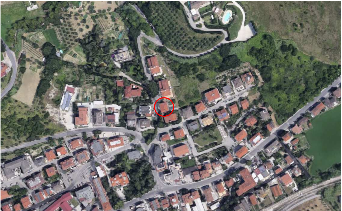
Fig. 1 Identificazione del fabbricato su immagine aerea

Di seguito si riportano alcune immagini di inquadramento: